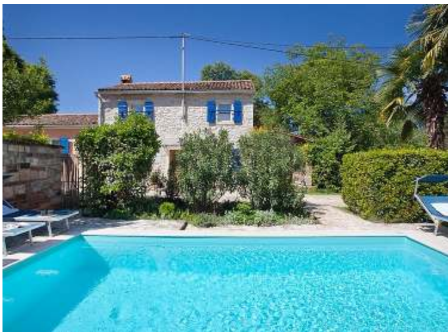
Slika br. 35: Kuća za odmor u Juricanima