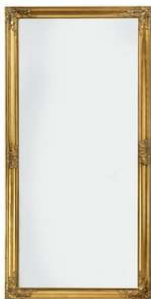
Slika br. 14: ogledalo za cijelu figuru RUDE

Ogledalo s okvirom od zlatnog lakiranoga masivnoga drva.