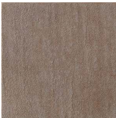
Slika br. 3: Langhe cortemilla podne pločice za kupaonicu