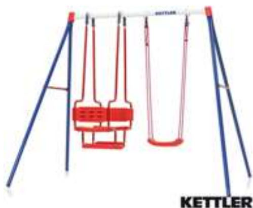
Slika br. 34: ljujjačka KETTER BASIC 3

- Dvostruka ljujjačka sa gondolom KETTER BASIC 3 36