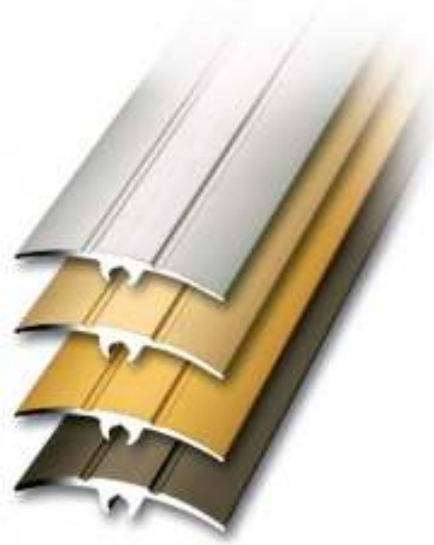
Slika br. 7: brončana lajsna