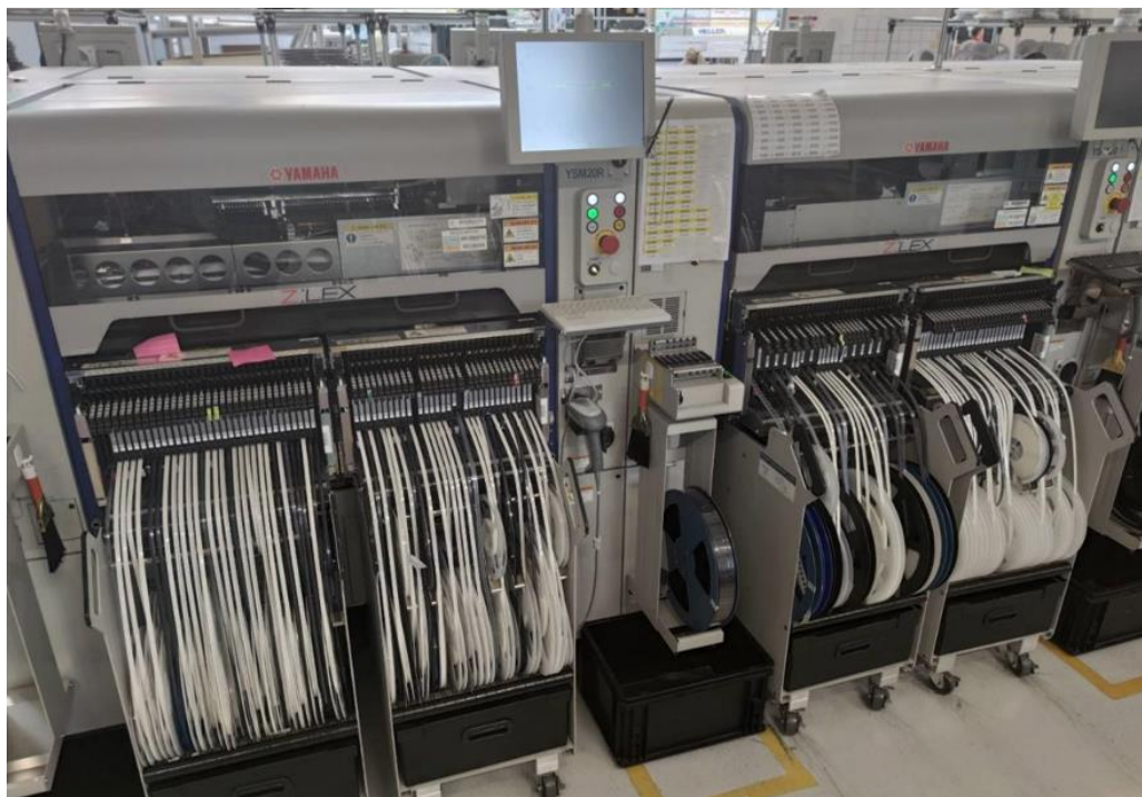
Slika 6: SMD linija za proizvodnju tiskanih ploča

Zatim slijedi probna proizvodnja. S obzirom na tok proizvodnje, u ovom slučaju se kreće s proizvodnjom tiskanih pločica na SMD ( engl. SMD, Surface Mounting Device ) liniji. Procesni inženjer dobiva programe potrebne za proizvodnju na raznoj opremi na SMD liniji od strane "Source owner". Započinje proizvodnju tiskane ploče te prilagođava uređaje dok ne dobije željeni rezultat.