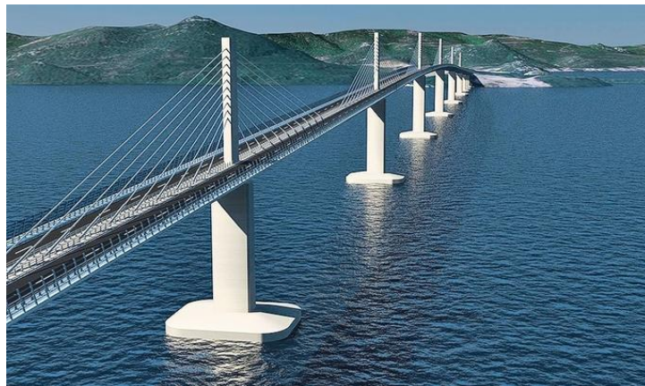
Slika 1. Projekt Pelješkog mosta