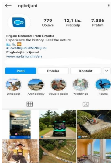
Slika 4. Instagram profil NP Brijuni