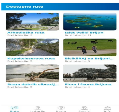
Slika 6. Izgled mobilne aplikacije NP Brijuni

U aplikaciji su glavne značajke koje vidimo info, usluge, kulturno povijesna baština, prirodna baština, sportsko rekreativne aktivnosti, smještajni objekti te fotogalerija.