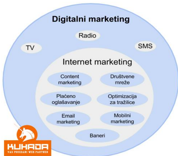
Slika 1. Digitalni marketing preuzeto - https://kuhada.com/blog-novosti-i-najave/47-vijesti/359-sto-je-digitalni-internet-marketing-razlika-inbound-outbound-marketing.html 17.09.2020