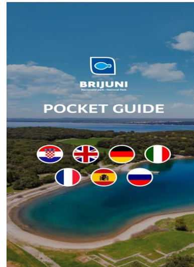
Slika 5. Početna stranica mobilne aplikacije

https://www.instagram.com/npbrijuni/?hl=hr 17.09.2020