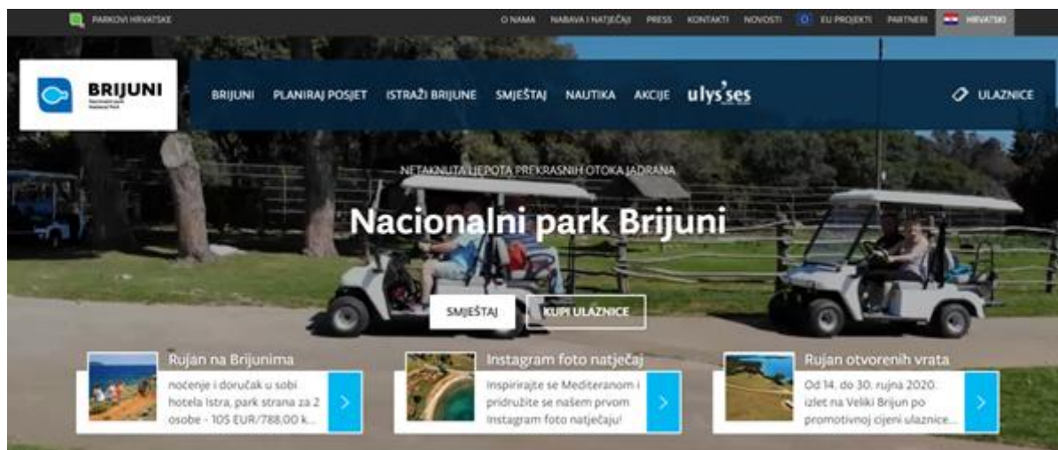
Slika 3. Izgled web početne web stranice NP Brijuni- https://www.np-brijuni.hr/hr 17.09.2020

Na naslovnoj slici web stranice vidimo ime nacionalnog parka s njegovim digitalnim logom koji je riba. Jednostavno se može klikom rezervirati smještaj i kupiti ulaznice za nacionalni park. Postoje padajući izbornici koji nas lako usmjeravaju na informacije koje su nam potrebne, odnosno jednom turistu koji želi posjetiti Brijune. Tu možemo dobiti informacije općenito o NP Brijuni, što sve možemo istražiti tamo, sva događanja koja se dešavaju u određeno doba godine.