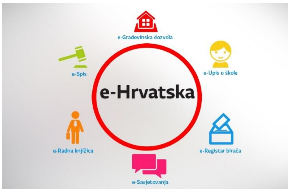
Slika 4. Uprava.gov.hr, < https://uprava.gov.hr/istaknute-teme/drzava-bez-papira-e-hrvatska/14401 > (28.09.2020.)

Omogućiti će se građanima lakše preuzimanje dokumentacije iz primjerice zdravstvenog osiguranja, mirovinskog sustava, porezne ili carinske uprave i dr. Omogućiti će se i pristup raznim obrtnicima, poljoprivrednicima, osobama koje su ovlaštene za zastupanje pravnih osoba u njihove register. Također se omogućuje elektroničko plaćanje upravnih pristojbi i naknada npr: sudskih, javnobilježničkih i ostalih. Glavni cilj je omogućavanje plaćanja cjelokupne usluge, a shodno tome