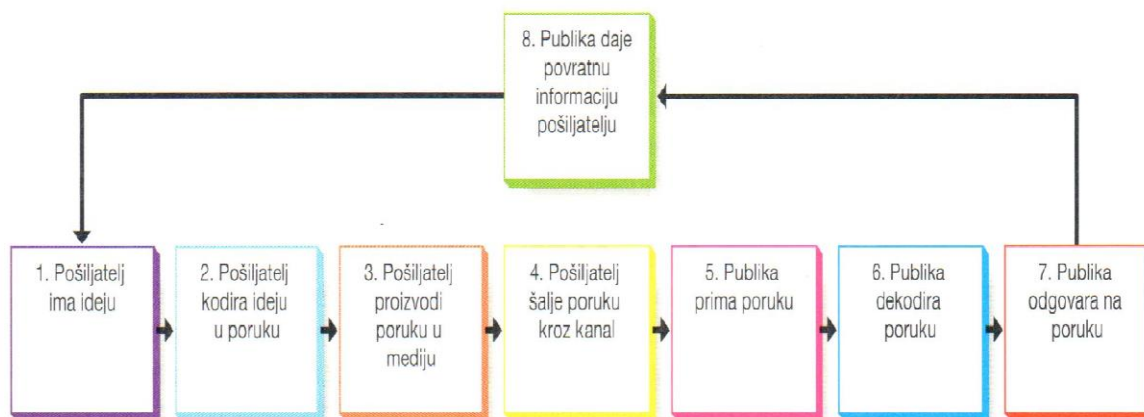
Slika 1. Komunikacijski proces (Bovee i Thill, 2013)