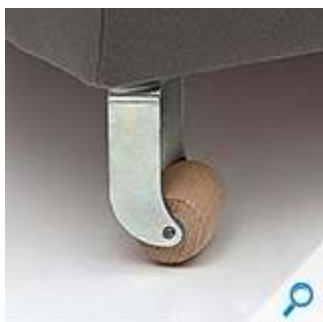
Slika br. 9: rolica HESPO RD