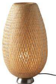
Slika br. 13: noćna svjetiljka BOJA

Sjenilo izrađeno od pletenog bambusa stvara dekorativne sjene po zidu.