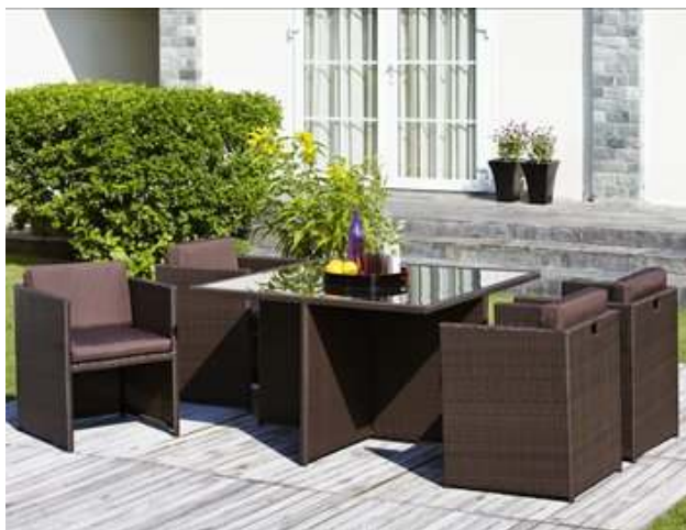
Slika br. 32: Vrtna garnitura ATALANTA

- Vrtna garnitura ATALANTA; materijal: čelik/staklo/pet 34