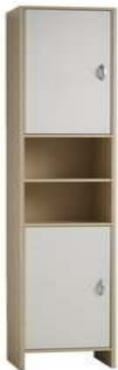
Slika br. 30: ormarić GLEJBJERG

- Ormarić GLEJBJERG; 2 vrata, 2 police 32