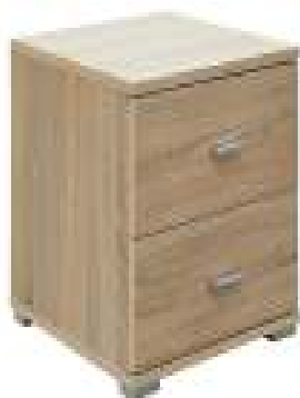
Slika br. 12: Iga noćni ormarić