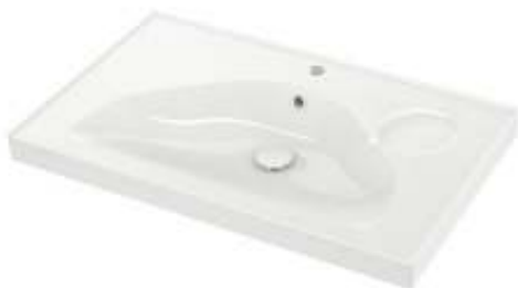
Slika br. 24: umivaonik EDEBOVIKEN