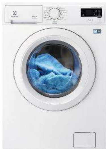
Slika br. 28: perilica sušilica Electrolux

- Electrolux perilica sušilica EWW1476WD 30