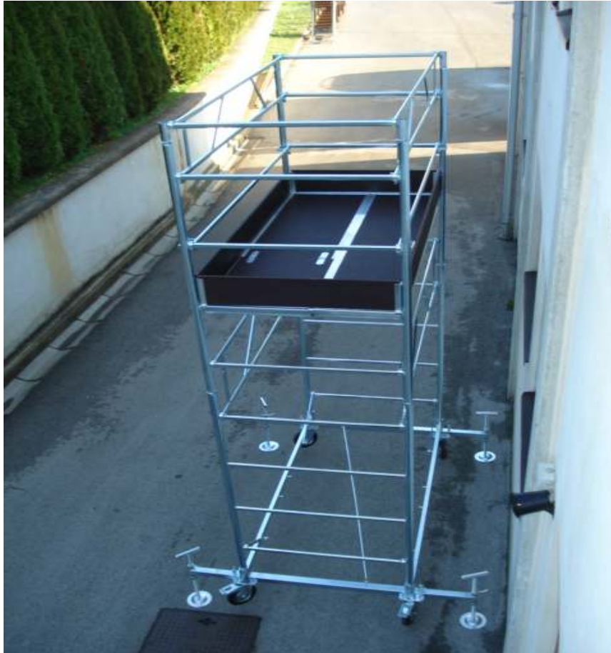
Slika br. 2: pokretna skela AM-10