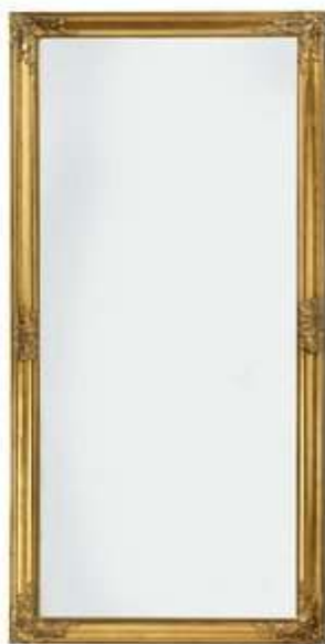
Slika br. 14: ogledalo za cijelu figuru RUDE

Ogledalo s okvirom od zlatnog lakiranoga masivnoga drva.