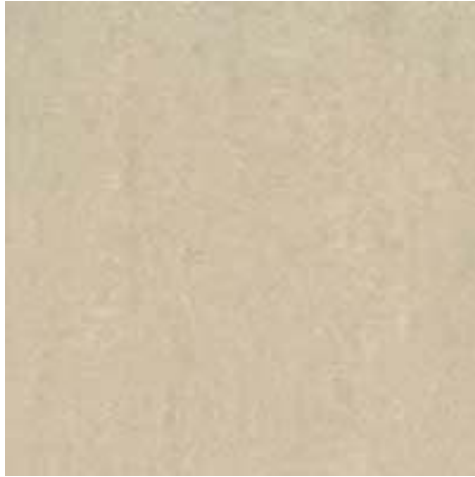
Slika br. 4: Lounge light grey zidne pločice za kupaonicu