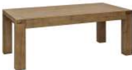
Slika br. 19: stolić za dnevni boravak ARCADIA