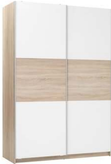
Slika br. 15: ormar SATTRUP

Ormar od melamina u boji hrasta i bijeloj boji. S dvama kliznim vratima, dvije police i dvije šipke za vješalice. Veličina: Š150xV218xDub62 cm.