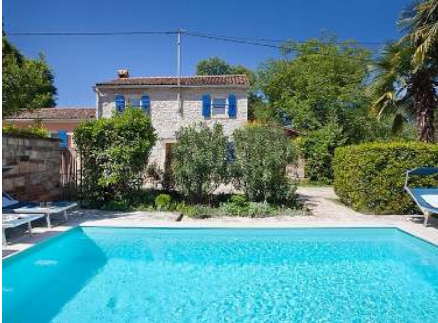
Slika br. 35: Kuća za odmor u Juricanima