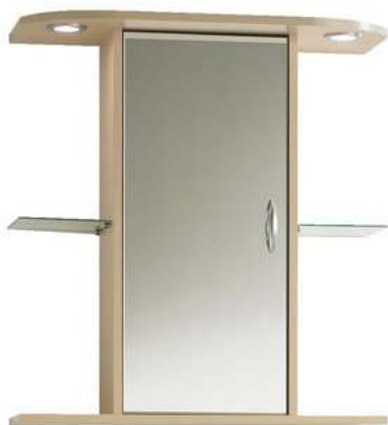
Slika br. 29: ormarić GLEJBJERG

- Zidni kupaonski ormarić GLEJBJERG s ogledalom 31