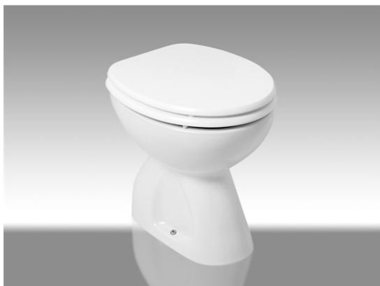
Slika br. 26: Toaletna školjka INKER NEO