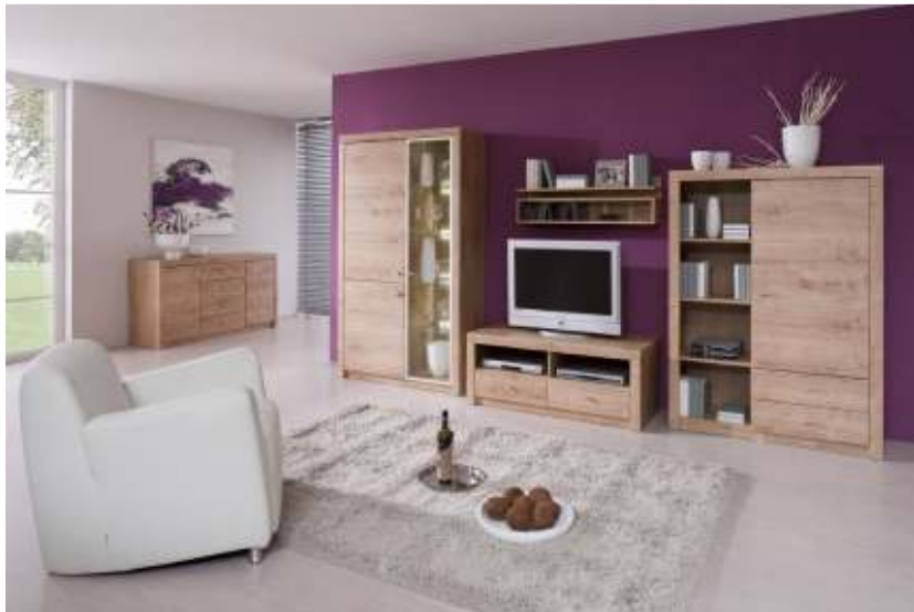
Slika br. 17: regal SOLID