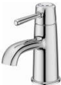
Slika br. 25: slavina GRANSKAR