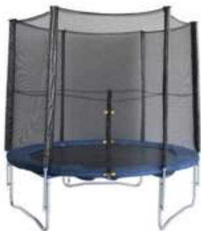
Slika br. 33: trampolin