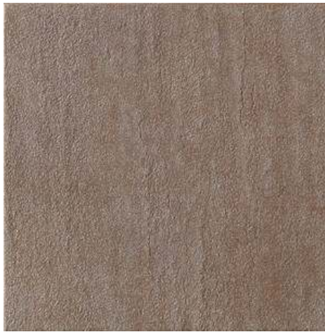
Slika br. 3: Langhe cortemilla podne pločice za kupaonicu