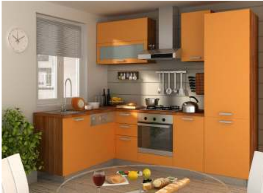
Slika br. 16: kuhinja MAGIC