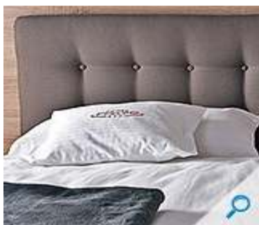
Slika br. 10: uzglavlje HESPO TIME

Uzglavlje se može postaviti na krevet ili pričvrstiti na zid. Visina uzglavlja Time iznosi 120 cm. Proizvodi se u velikom broju boja i materijala.