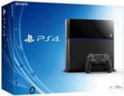
Slika br. 22: igraća konzola PS4