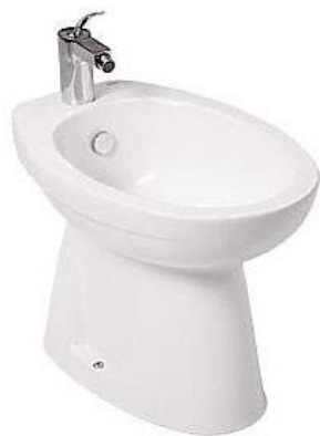
Slika br. 27: bide INKER IVA