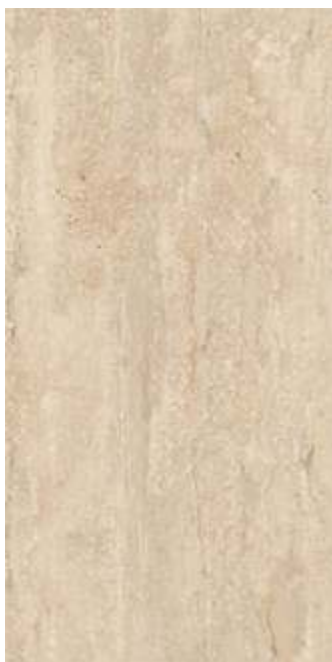
Slika br. 6: Roma glossy beige zidne pločice za kuhinju