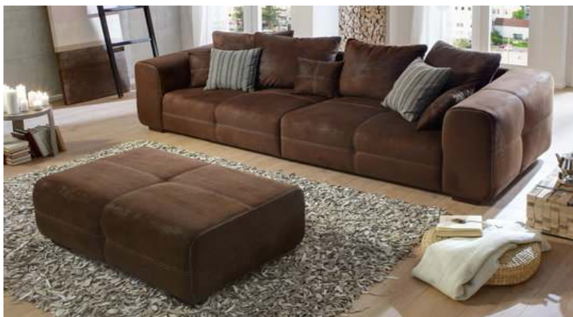
Slika br. 18: trosjed s tabureom TWIN

U cijenu trosjeda uključena su četiri velika smeđa jastuka i dva mala.