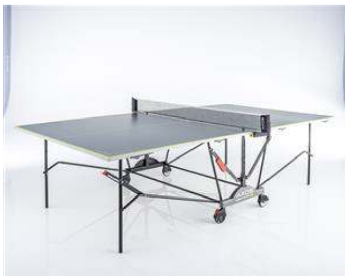
Slika br. 31: stol za stolni tenis Kettler

- Stol za stolni tenis Kettler Axos OUTDOOR 2, vanjski 33