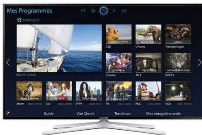
Slika br. 21: tv SAMSUNG

- SAMSUNG UE48H6400 LED TV, FULL HD, Smart 3D TV