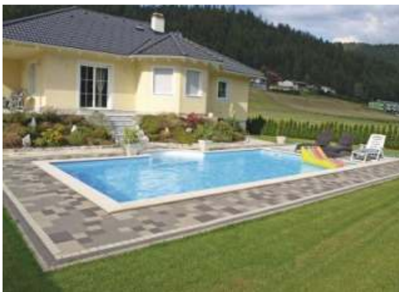
Slika br. 1: ugradbeni bazen CLASSIC SET 4

Ugradbeni bazen CLASSIC složimo od stiropor blokova Big Stone 125×25×50 cm koje napunimo betonom. Nakon toga ga presvučemo bazenskom folijom debljine 0,8 mm, koja je već tvornički skrojena. PVC folija je visoko frekventno varena, UV stabilizirana te otporna na niske temperature. Način pričvršćivanja bazenske folije izvodi se s objesnim trakom. Ovaj bazen sadrži podnu izolaciju od stiropora. 8