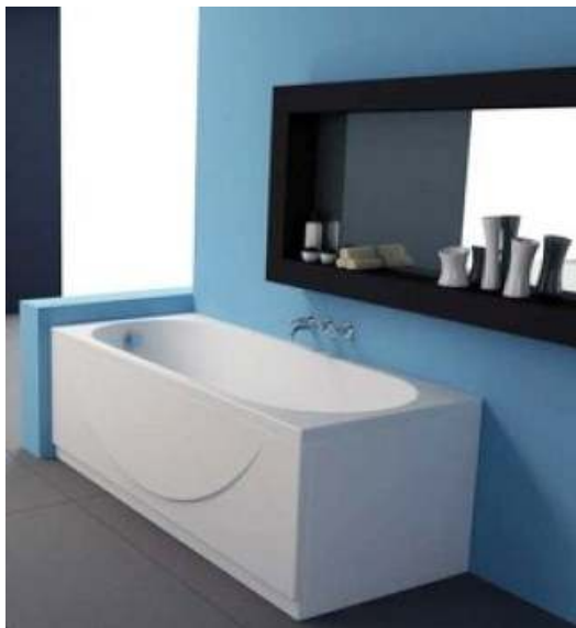
Slika br. 23: kada TAMIA