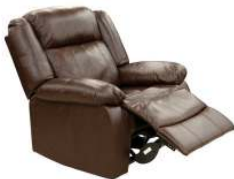
Slika br. 20: fotelja FORTUNA

- fotelja FORTUNA s relaksirajućom funkcijom