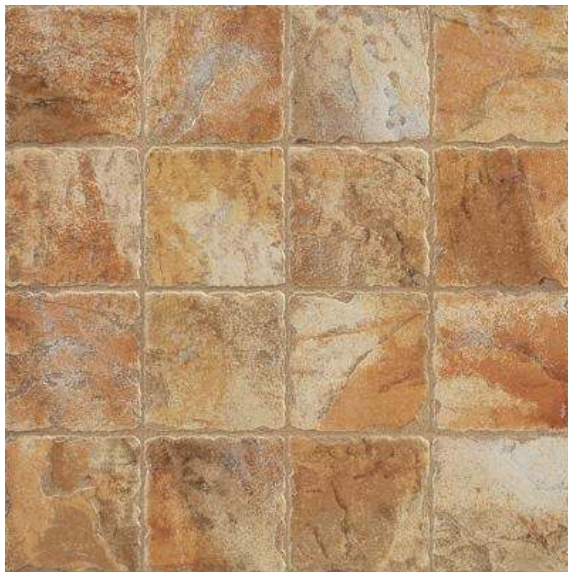
Slika br. 5: Color stone peacock yellow podne pločice za kuhinju