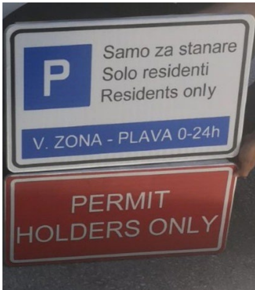
Slika 4. Holders-only tabla