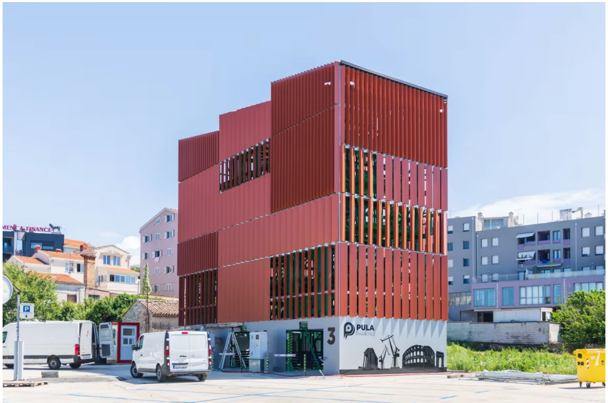
Slika 9. Rolo garaže