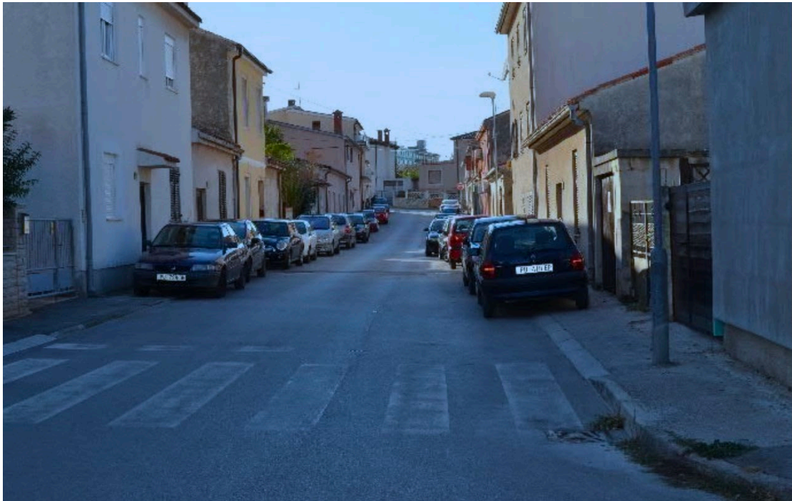
Slika 5. Parkirani automobili zauzimaju pješačke staze