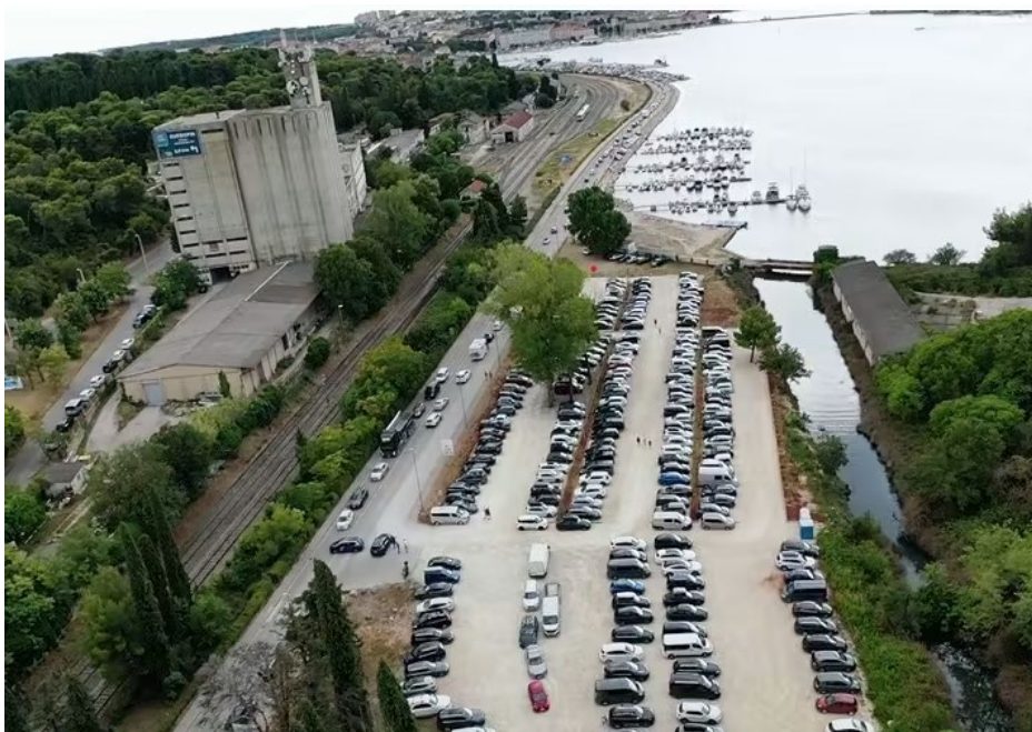
Slika 14. Parkiralište Mandrač

Uređenje Mandrača je izvršeno u tri faze. U prvoj fazi bilo je potrebno očistiti lokaciju od niskog raslinja i grmlja te je postavljena i uređena podloga. U drugoj fazi uslijedilo je hortikulturno uređenje, postavljena je led rasvjeta i uređeni su ostali sadržaji. (Glas Istre, 2023). U trećoj fazi, na parkiralištu je postavljeno 8 nadzornih kamera, odnosno sustav za nadzor i čuvanje lokacije od eventualne devastacije imovine i opreme, kako su naveli iz Pulaparkinga. Instaliranim kamerama pokriveni su parkiralište i svi prilazi na njega. Video snimke se koriste za praćenje prometa, nadzor reda i sigurnosti te za kontrolu naplate parkiranja. Snimke se čuvaju u Pulaparkingu, a prosječno vrijeme čuvanja snimaka je tri tjedna. (Istra24, 2023).