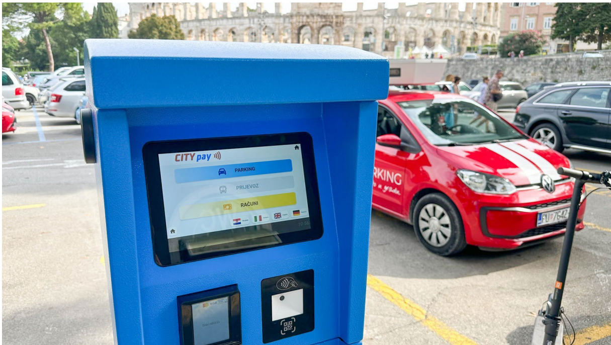
Slika 6. City pay naplatni aparat