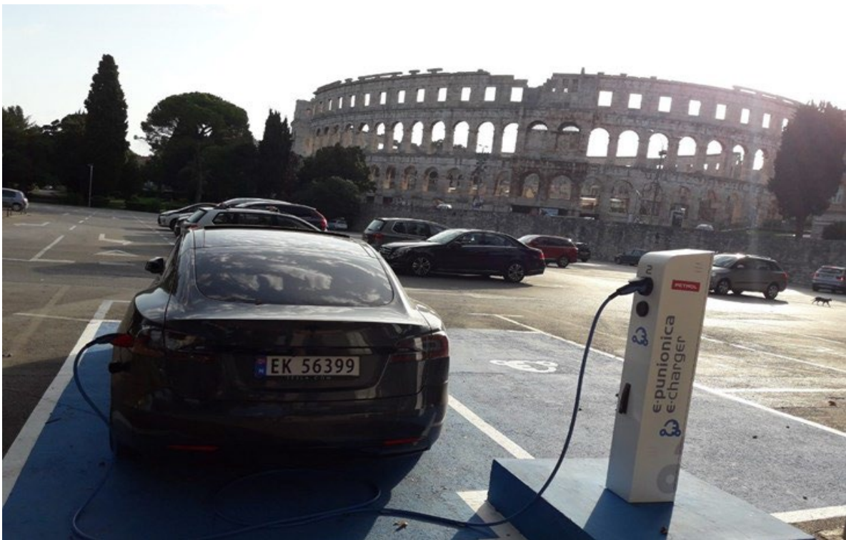
Slika 2. E-punionica na Karolini