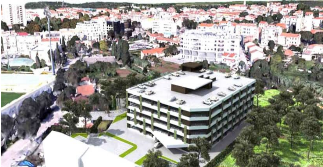
Slika 10. Simulacija buduće garažne kuće