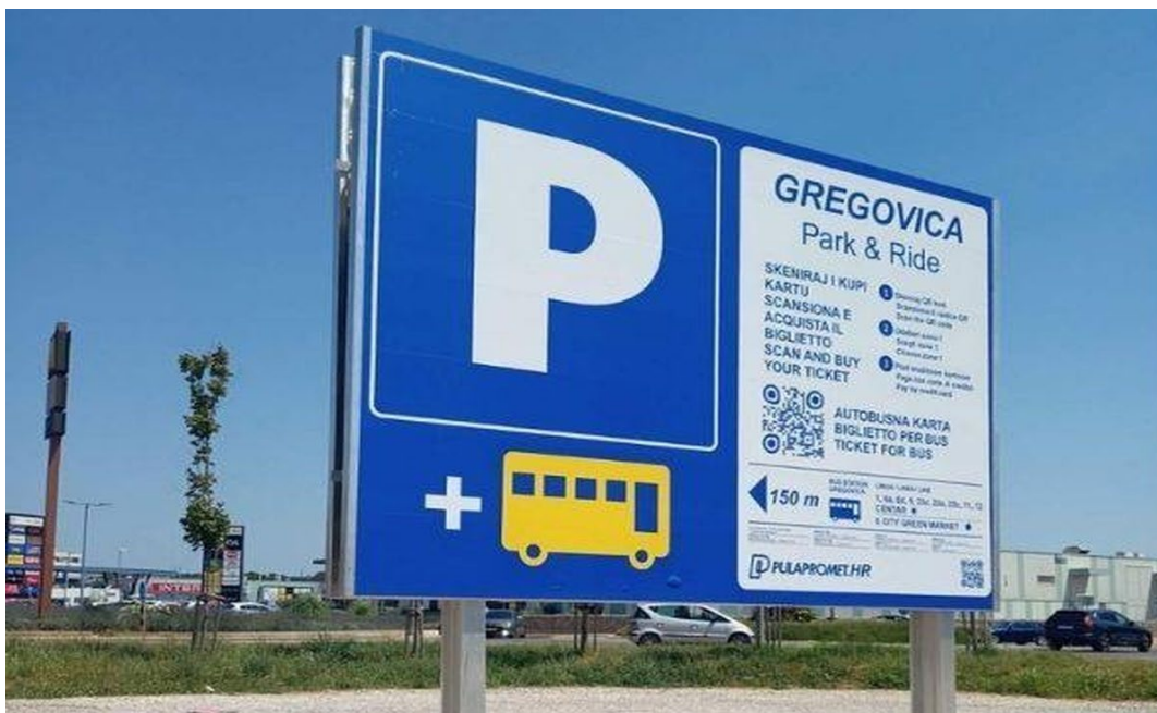
Slika 12. Informacijska tabla na parkiralištu Gregovica