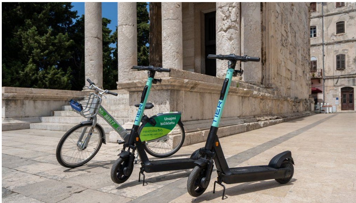
Slika 8. Bicikli i romobili koje je moguće unajmiti kroz susatv Bičikleta