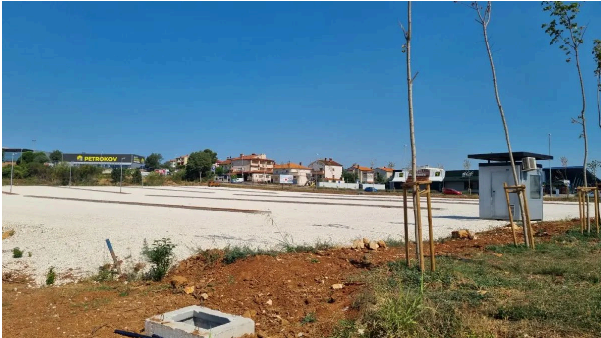
Slika 13. Parkiralište Gregovica