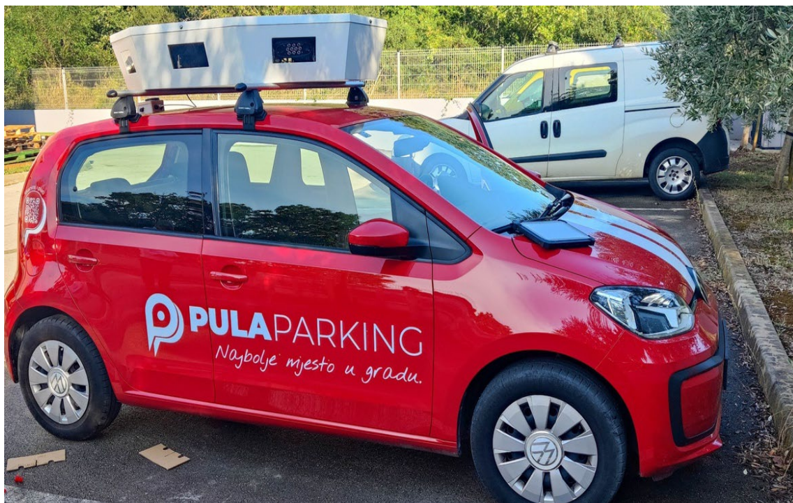
Slika 11. Pametno vozilo Pula Parkinga