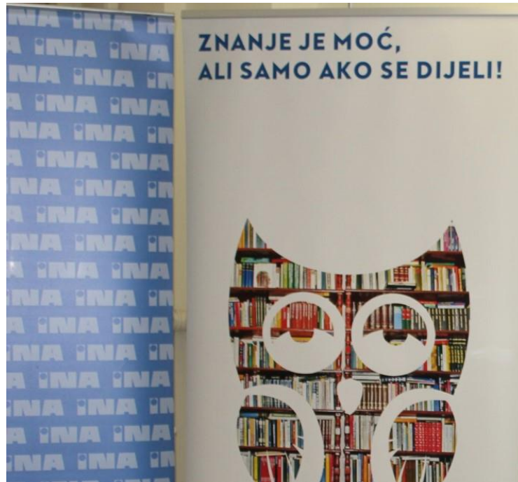
Slika 16. Inina „SpajalICA HUB“, preuzeto sa: https://odgovorno.hr/dop-price/inina-spajalica-hub-inovativna-platforma-za-dijeljenje-znanja-dar-je-mnogim-udrugama/ , pristup 01.07.2021.

Ujedno INA se sustavno uključila u rješavanje problema razminiranja Hrvatske, te je od 2011. godine do danas donirala 1,8 milijuna kuna, posebice za područje Vukovarsko-srijemske i Sisačko-moslavačke županije.