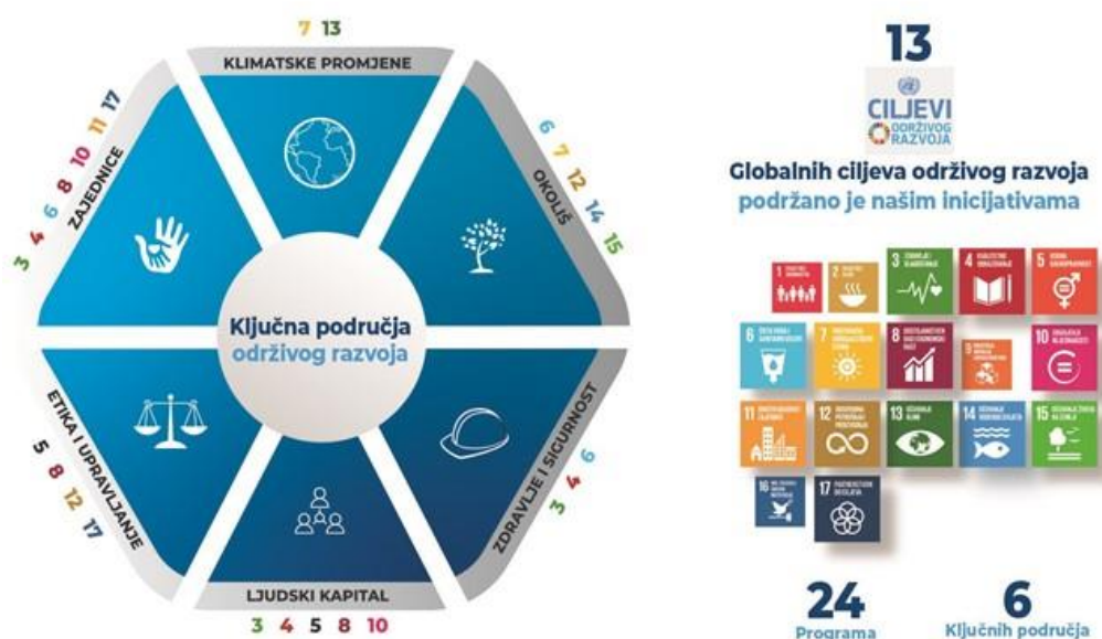
Slika 13. „Ina – primjer dobre prakse“, preuzeto sa: https://www.hup.hr/ina-od-2016-provodimo-kljucne-ciljeve-i-programe-odrzivog-razvoja-do-2020-v2.aspx , pristup: 08.06.2021.

Održivi razvoj jedan je od temeljnih načela poslovanja Ine, a to zahtijeva proaktivno upravljanje rizicima i novim poslovnim mogućnostima, koja se odnose na rješavanje dugoročnih ekonomskih, okolišnih i društvenih pitanja. Od 2016. godine INA je integrirala Ključne ciljeve i programe održivog razvoja do 2020. godine. Kroz definirane programe i aktivnosti koji su u izravnoj korelaciji s Globalnim ciljevima održivog razvoja, INA Grupa provedbom zadanih programa i akcija izravno doprinosi ostvarenju 13 od 17 Globalnih ciljeva održivog razvoja (Slika 7.) Razvoj godišnjih akcijskih planova, te njihova realizacija koja se prati tromjesečno (najmanja zadana realizacija 85%) (Slika 13.) obuhvaća šest ključnih područja i 24 programa unutar njih. Kao divizijski cilj kompanije, postavljena je realizacija objedinjenog akcijskog plana održivog razvoja, zaštite zdravlja, sigurnosti i okoliša. Projekti kao i aktivnosti povezani s održivim razvojem sastavni su dio poslovnog plana društava INA Grupe, stoga je primjerice u 2018. godini provedeno ukupno 62 akcije održivog razvoja na razini INA Grupe, s ukupnom realizacijom od 98%. 35