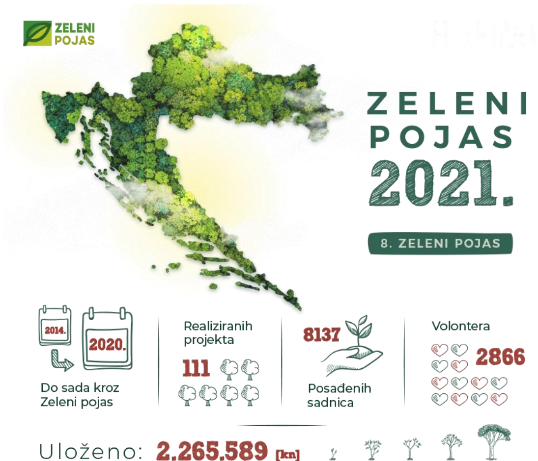
Slika 15. „Zeleni pojas – INA“, preuzeto sa: https://realdigital.live/ina-zelenipojas-2021/ , pristup 01.07.2021.

Ove godine INA obilježava 8.-i rođendan natječaja, te s ponosom ističe svih 111 projekata koje je sufinancirala s ukupnim iznosom više od 2.265.589,00 Kn. Proteklih 7 godina u suradnji sa partnerima, posađeno je 8.137 sadnica drveća, cvijeća i raslinja, te je zazelenjen prostor od 65.424 m 2 . INA je kroz taj projekt uređivala zelene staze, obnavljala odmorišta i dječja igrališta, sudjelovala u akciji čišćenja livada, šuma, podmorja, priobalja, jezera i rijeka. Ujedno je obnovila i prihvatilišta za životinje, otvorila učionice u prirodi, te podržavala rad učeničkih zadruga i edukacija o prirodi.