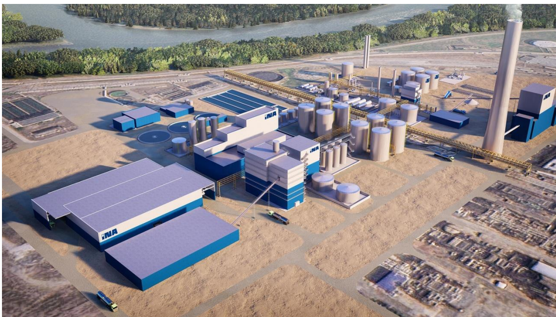
Slika 16. „Projekt Biorafinerija“, dostupno na: https://www.ina.hr/biorafinerija/o-projektu/?fbclid=IwAR3QQfq5hNoLACoDlxEsQ176OxbvHkb0mk1LSny_LbgsqfGWTV0gfGxQisA , pristup 03.07.2021.

Ujedno planira se korištenje sredstava Europskog poljoprivrednog fonda za ruralni razvoj, ponajviše za aktivnosti koje su vezane uz uspostavu nasada energetske biljke miskantus, što uključuje i aktivaciju zapuštenog poljoprivrednog zemljišta. Valja naglasiti da se energetske doprinos proizvedenog bioetanola druge generacije vrednuje dvostruko pri ispunjenju ciljeva plasmana biogoriva na tržište. 37