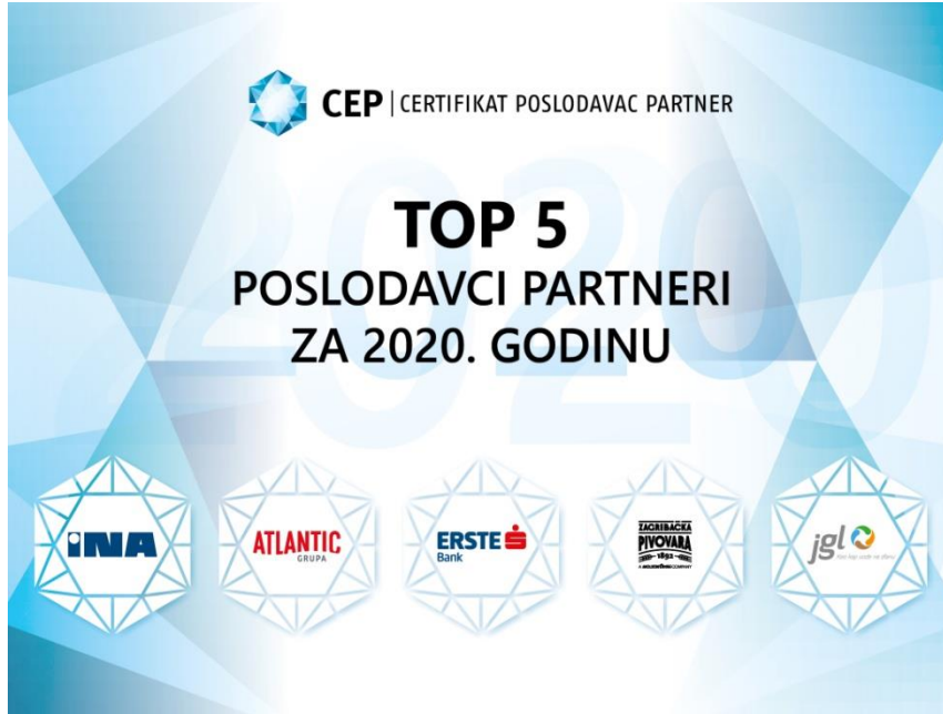
Slika 9.: „INA – Certifikat poslodavac partner“, dostupno na: https://www.poslovni.hr/wp-content/uploads/2021/06/8-ina-1600x1000.jpg , pristup: 02.07.2021.

Ina d.d. dobitnik je mnogih nagrada, od kojih se ističu „Certifikat Poslodavac partner“ (potvrda izvrsnosti u upravljanju ljudskim resursima, Slika 9.), „Poslodavac prvog izbora“ (Ina d.d. je među 10 top poslodavaca), „Poslodavac godine za osobe sa invaliditetom (zapošljavanje osoba sa invaliditetom, Slika 10.), „Zlatni indeks“ za doprinos kvalitetnijem studentskom životu, obrazovanju i stručnom usavršavanju studenata (Slika 11.), nagrada „Indeks DOP“ u kategoriji odgovorne politike raznolikosti i zaštiti ljudskih prava, „Green frog“ nagrada za najbolje izvješće o održivom razvoju u Hrvatskoj za 2017.god., nagrada „Žuti okvir – National Geographic Hrvatska“ za projekt „Zdravlje“ – integracija zaštite i promicanja zdravlja u tvrtkama Ina Grupe i sl. 32