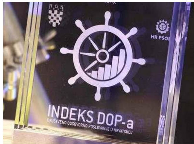
Slika 3. „Nagrada Indeks DOP-a“, dostupno na: https://jatrgovac.com/usdocs/indeks-dop-1.jpg , pristup: 30.06.2021.