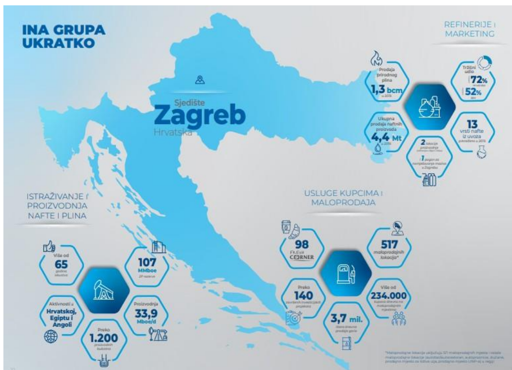
Slika 5. „Ina Grupa“, preuzeto sa Godišnjeg izvještaja Ine d.d., 2019.god., dostupno na: https://www.ina.hr/wp-content/uploads/2020/05/AR_2019_CRO_30 , pristup 09.03.2021.

Slika 5. prikazuje ukratko pregled poslovanja Ina grupe koja posluje više od 65 godina, u Hrvatskoj i inozemstvu, a od toga ima 72% tržišnog udjela u Hrvatskoj, a 52% u BiH. Ujedno ima preko 140 završenih investicijskih projekata, 517 maloprodajnih lokacija, prodaju od 3,7 mil. litara goriva dnevno, te više od 234.000 dnevnih kupaca goriva na maloprodajnim lokacijama.