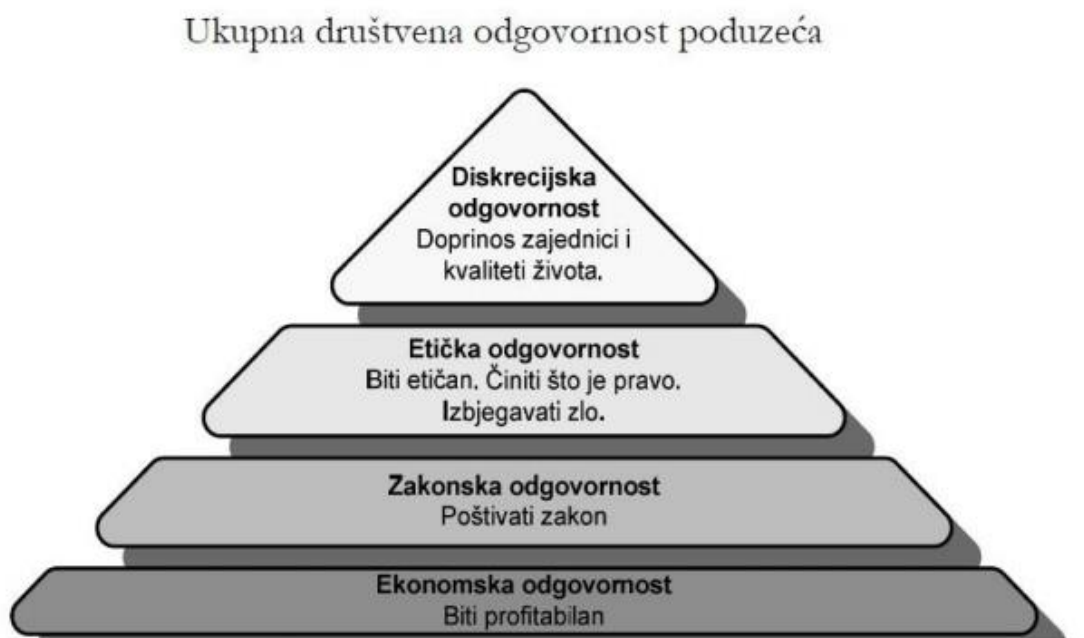
Slika 1. Hijerarhija društvene odgovornosti poduzeća , Izvor: Buble M., „ Poslovno vođenje “ (2011), Zagreb, M.E.P., str. 284.

Slijedi slika koja prikazuje hijerarhiju društveno odgovornog poduzeća. (Slika 1)