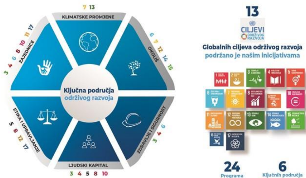
Slika 13. „Ina – primjer dobre prakse“, preuzeto sa: https://www.hup.hr/ina-od-2016-provodimo-kljucne-ciljeve-i-programe-odrzivog-razvoja-do-2020-v2.aspx , pristup: 08.06.2021.

Održivi razvoj jedan je od temeljnih načela poslovanja Ine, a to zahtijeva proaktivno upravljanje rizicima i novim poslovnim mogućnostima, koja se odnose na rješavanje dugoročnih ekonomskih, okolišnih i društvenih pitanja. Od 2016. godine INA je integrirala Ključne ciljeve i programe održivog razvoja do 2020. godine. Kroz definirane programe i aktivnosti koji su u izravnoj korelaciji s Globalnim ciljevima održivog razvoja, INA Grupa provedbom zadanih programa i akcija izravno doprinosi ostvarenju 13 od 17 Globalnih ciljeva održivog razvoja (Slika 7.) Razvoj godišnjih akcijskih planova, te njihova realizacija koja se prati tromjesečno (najmanja zadana realizacija 85%) (Slika 13.) obuhvaća šest ključnih područja i 24 programa unutar njih. Kao divizijski cilj kompanije, postavljena je realizacija objedinjenog akcijskog plana održivog razvoja, zaštite zdravlja, sigurnosti i okoliša. Projekti kao i aktivnosti povezani s održivim razvojem sastavni su dio poslovnog plana društava INA Grupe, stoga je primjerice u 2018. godini provedeno ukupno 62 akcije održivog razvoja na razini INA Grupe, s ukupnom realizacijom od 98%. 35