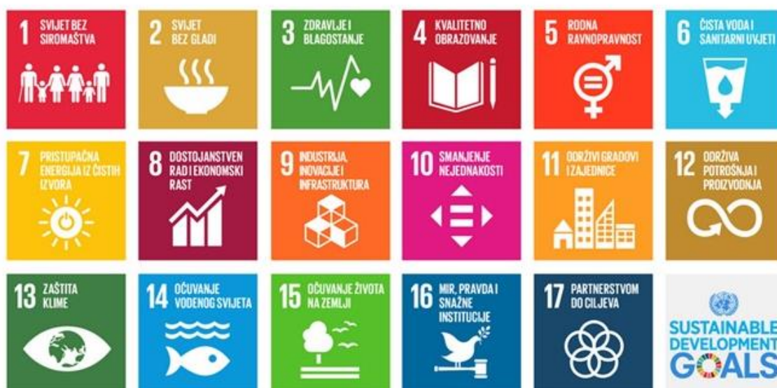
Slika 14. „Globalni ciljevi održivog razvoja“, preuzeto sa: http://www.idop.hr/hr/izvjestavanje/izvjestavanje/gri-izvjestavanje/pridruzite-se-gri-ju-i-un-global-comapactu-u-oblikovanju-izvjestavanja-o-globalnim-ciljevima-odrzivog-razvoja/ , pristup: 08.06.2021.