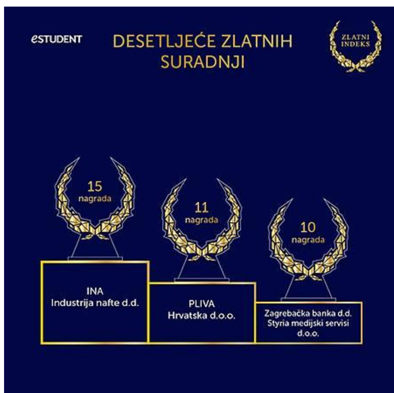
Slika 11.: „INA – dobitnik nagrade „Zlatni indeks““, dostupno na: https://www.facebook.com/INA.Hrvatska/photos/a.264566870271373/3108385982556100/ , pristup: 02.07.2021.