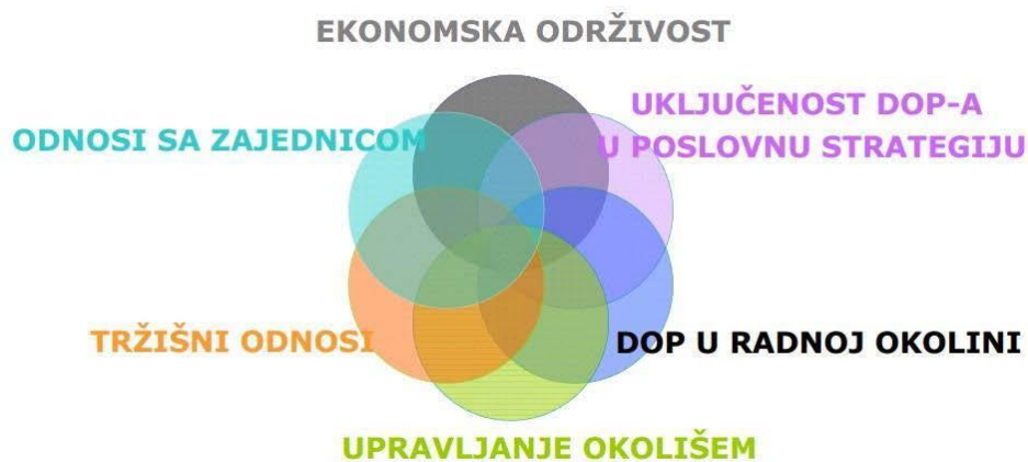
Slika 2. „Dimenzije Indeksa DOP-a“, dostupno na: https://www.vup.hr/Data/Files/141027102711512.pdf , pristup 04.07.2021.

odgovornog poslovanja u poslovnu strategiju, radnu okolinu, zaštitu okoliša, te tržišne odnose i odnose sa zajednicom (Slika 2.). Nagrada Indeks DOP-a nastala je po uzoru na svjetske metodologije, a ponajviše prema Business in the Community CR Index metodologiji. Dodjela nagrade i mjerenja provode se kontinuirano još od 2008. godine, a njena svrha je da potiče konkurenciju na razvoj DOP-a u svojem poslovanju, da inspirira, te da ističe najbolje primjere u praksi kao pozitivan primjer drugima. 21