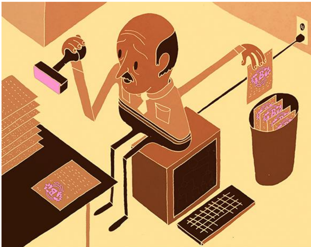
Slika 2. Šaljivi prikaz službnika koji sjedi na računalu