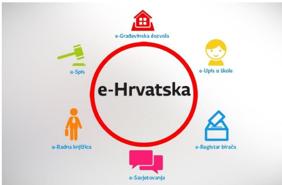
Slika 4. Uprava.gov.hr, < https://uprava.gov.hr/istaknute-teme/drzava-bez-papira-e-hrvatska/14401 > (28.09.2020.)

Omogućiti će se građanima lakše preuzimanje dokumentacije iz primjerice zdravstvenog osiguranja, mirovinskog sustava, porezne ili carinske uprave i dr. Omogućiti će se i pristup raznim obrtnicima, poljoprivrednicima, osobama koje su ovlaštene za zastupanje pravnih osoba u njihove register. Također se omogućuje elektroničko plaćanje upravnih pristojbi i naknada npr: sudskih, javnobilježničkih i ostalih. Glavni cilj je omogućavanje plaćanja cjelokupne usluge, a shodno tome