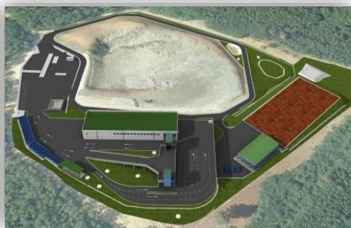
Slika 2 - Cere

Na odlagalištu Cere izgrađena je Pretovarna stanica (na slikama) na kojoj se pretovaruje otpad za prijevoz na Županijski centar za gospodarenje otpadom Kaštijun . Po uspostavi Centra prestalo je trajno odlaganje miješanog komunalnog otpada i biorazgradivog otpada na odlagalištu Cere.