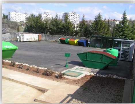
Slika 4 - Reciklažno dvorište Starci u Labinu

U Pulsskoj ulici u Labinu uređeno je i reciklažno dvorište (RD) koje zaprima od građana krupni otpad, kao i posebne vrste otpada, i to besplatno. Također, tijekom godine više puta se u raznim naseljima postavlja i mobilno reciklažno dvorište (MRD) kojim se funkcija RD-a nastoji približiti i mještanima okolnih naselja i tako ih senzibilizirati da pravilno odlažu krupni otpad.