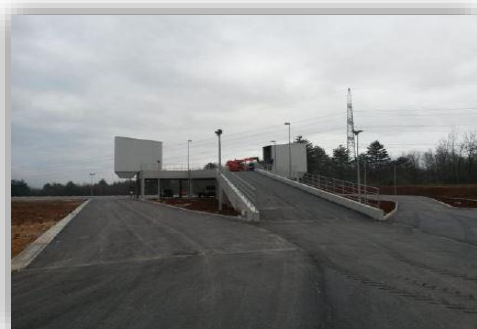
Slika 3 - Pretovarna stanica u Ceru