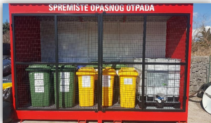
Slika 6 - Spremište opasnog otpada na reciklažnom dvorištu