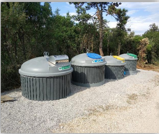
Slika 7 - Polupodzemni spremnici

Osim preuzimanja miješanog komunalnog otpada izravno od korisnika na mjestu nastanka, 1. MAJ d.o.o. otpad za reciklažu na području Labinštine odvojeno prikuplja na kućnom pragu (tzv. sustav "od vrata do vrata"), putem zelenih otoka, odnosno kontejnera smještenih na javnim površinama te putem reciklažnih dvorišta (mobilno i stacionarno reciklažno dvorište). Također, postoji sustav reciklažnih otoka s kontejnerima za odvojeno sakupljanje otpadnog tekstila.