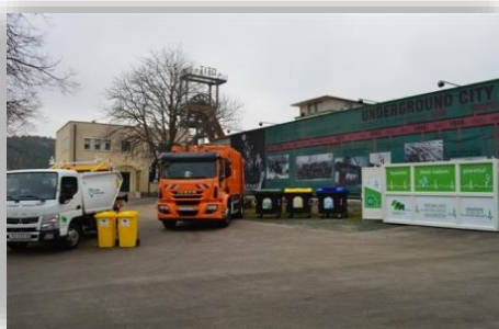
Slika 1 - Vozila za selektivni otpad.

Miješani komunalni otpad i biorazgradivog otpada se sakuplja putem kanti i kontejnera različitih veličina koje su opremljene opremom za identifikaciju (tzv. "čipirane" posude)