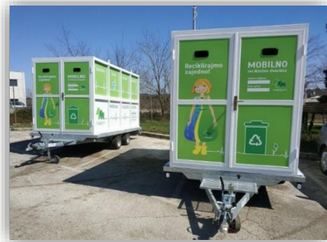
Slika 5 - Mobilna reciklažna dvorišta