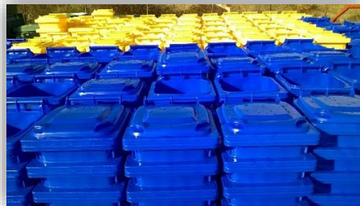
Slika 9 - Plastične kante za otpad