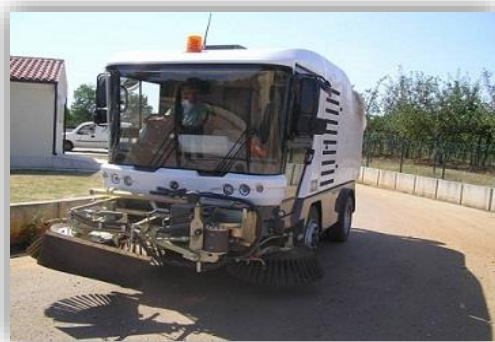
Slika 10 - Strojna čistilica

Osim toga, 1.MAJ d.o.o. vrši usluge ručnog i strojnog pometanja van javnih površina za privatne naručitelje te ih naplaćuje prema važećem cjeniku. U ovoj organizacijskoj jedinici zaposleno je desetak osoba