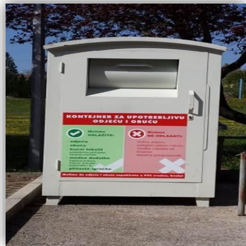
Slika 8 - Spremnik za tekstil