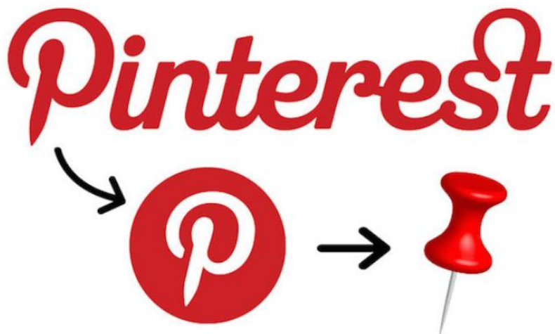
Slika 5. Pinterest logo