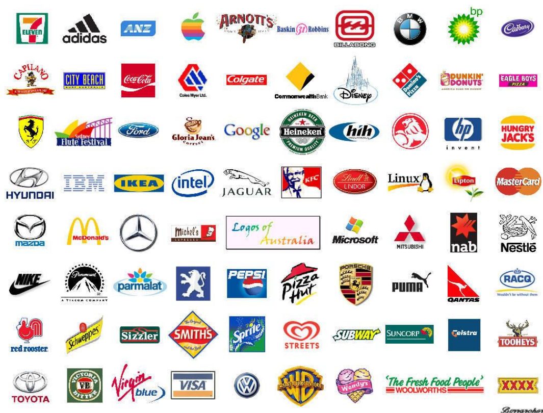
Slika 1. Svjetski poznate marke