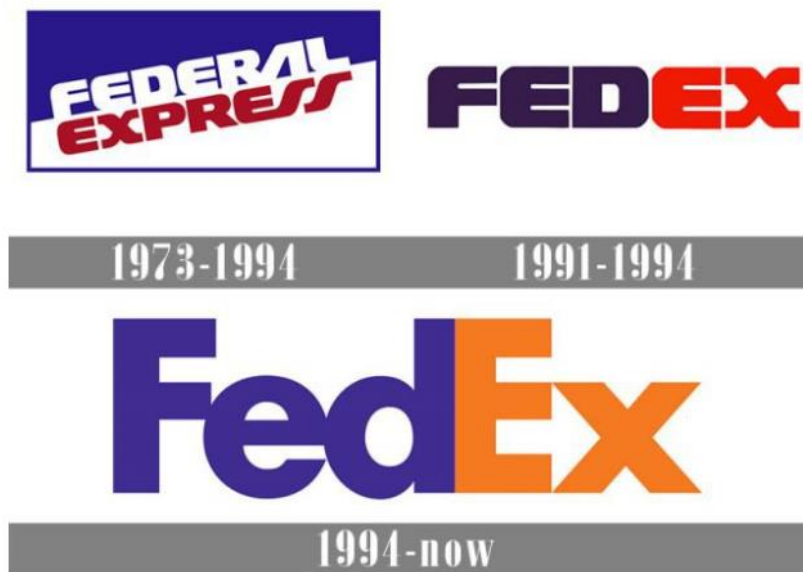
Slika 6. Logo FedEx-a od 1973. do danas