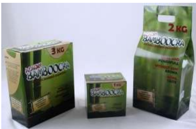
SLIKA 6 Aladin Bamboocha ugljen za nargilu

Također je vrlo bitno kakvu vrstu ugljena se koristi prilikom pripreme nargile. Idealno bi bilo koristiti takve vrste ugljena koje proizvode optimalnu temperaturu, gore dovoljno dugo i najbitnije od svega je da nemaju nikakav miris.