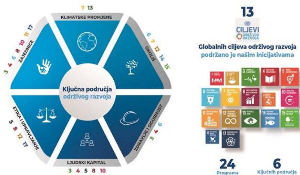
Slika 13. „Ina – primjer dobre prakse“, preuzeto sa: https://www.hup.hr/ina-od-2016-provodimo-kljucne-ciljeve-i-programe-odrzivog-razvoja-do-2020-v2.aspx , pristup: 08.06.2021.

Održivi razvoj jedan je od temeljnih načela poslovanja Ine, a to zahtijeva proaktivno upravljanje rizicima i novim poslovnim mogućnostima, koja se odnose na rješavanje dugoročnih ekonomskih, okolišnih i društvenih pitanja. Od 2016. godine INA je integrirala Ključne ciljeve i programe održivog razvoja do 2020. godine. Kroz definirane programe i aktivnosti koji su u izravnoj korelaciji s Globalnim ciljevima održivog razvoja, INA Grupa provedbom zadanih programa i akcija izravno doprinosi ostvarenju 13 od 17 Globalnih ciljeva održivog razvoja (Slika 7.) Razvoj godišnjih akcijskih planova, te njihova realizacija koja se prati tromjesečno (najmanja zadana realizacija 85%) (Slika 13.) obuhvaća šest ključnih područja i 24 programa unutar njih. Kao divizijski cilj kompanije, postavljena je realizacija objedinjenog akcijskog plana održivog razvoja, zaštite zdravlja, sigurnosti i okoliša. Projekti kao i aktivnosti povezani s održivim razvojem sastavni su dio poslovnog plana društava INA Grupe, stoga je primjerice u 2018. godini provedeno ukupno 62 akcije održivog razvoja na razini INA Grupe, s ukupnom realizacijom od 98%. 35