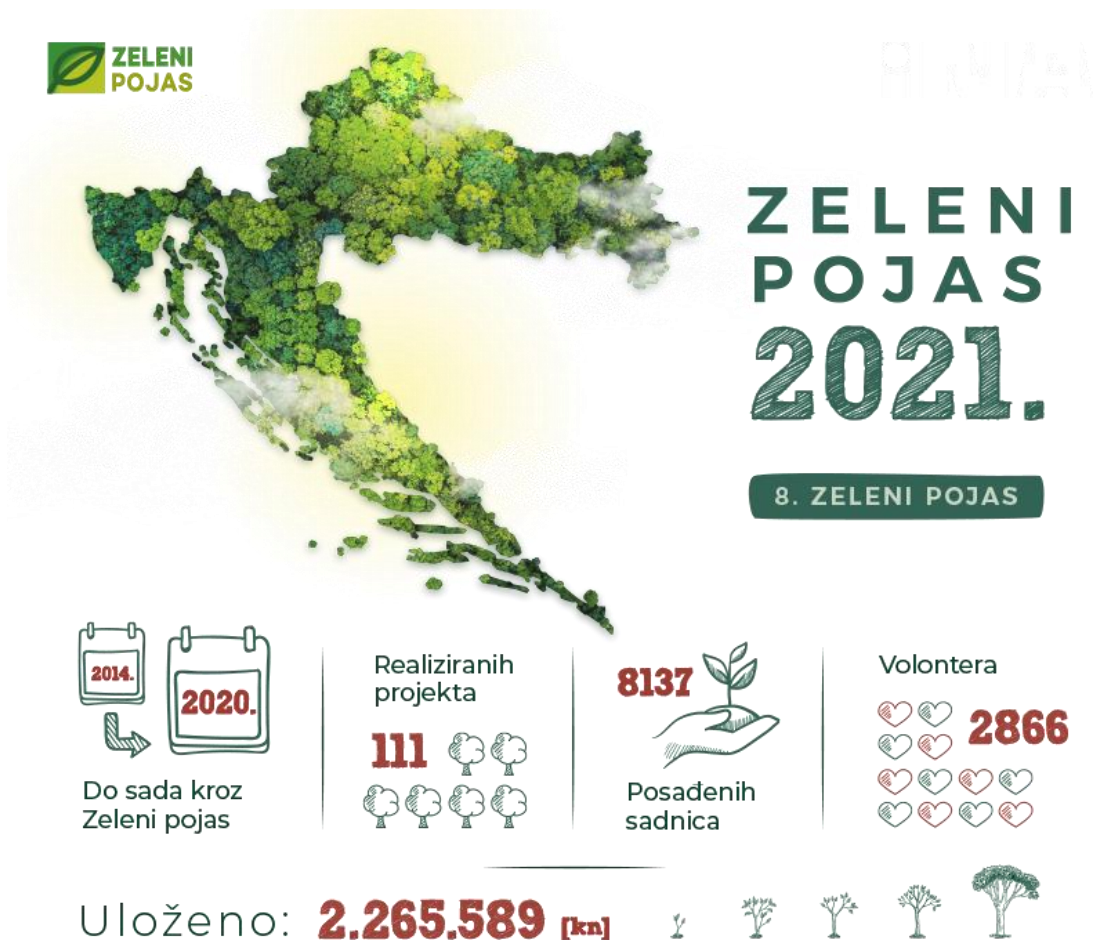
Slika 15. „Zeleni pojas – INA“, preuzeto sa: https://realdigital.live/ina-zelenipojas-2021/ , pristup 01.07.2021.

Ove godine INA obilježava 8.-i rođendan natječaja, te s ponosom ističe svih 111 projekata koje je sufinancirala s ukupnim iznosom više od 2.265.589,00 Kn. Proteklih 7 godina u suradnji sa partnerima, posađeno je 8.137 sadnica drveća, cvijeća i raslinja, te je zazelenjen prostor od 65.424 m 2 . INA je kroz taj projekt uređivala zelene staze, obnavljala odmorišta i dječja igrališta, sudjelovala u akciji čišćenja livada, šuma, podmorja, priobalja, jezera i rijeka. Ujedno je obnovila i prihvatilišta za životinje, otvorila učionice u prirodi, te podržavala rad ueničkih zadruga i edukacija o prirodi.