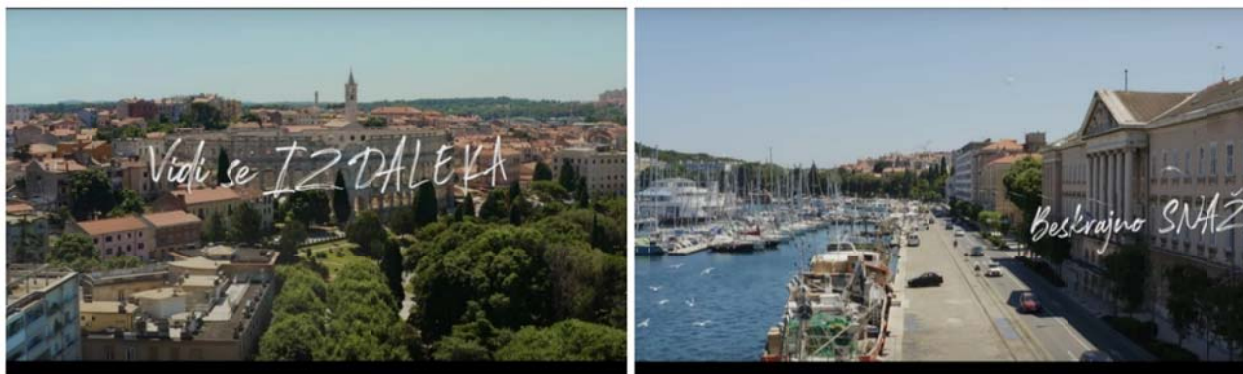
Slika 6 – Isječci iz spota „Vidi se iz daleka“

Za funkcioniranje obrta bitna je fleksibilnost pa su u početku pristajali na svakakve vrste projekata dok im se nije stvorio nekakav imidž ili portfolio radova koji prikazuje kvalitetu usluge. Započeli su s manjim projektima iz lokalne zajednice i tako odradili više videa za udruge s područja njihove općine, kao što su praćenje atletske utrke, otvaranje Arheološkog parka Vižula, praćenje raznih manifestacija sa istarskog područja. Radili su promotivna videa za beach barove, reklamna videa za razne tvrtke koje se bave turizmom kao što su prijevoz putnika brodom, iznajmljivanje vodenih skutera, buggy-a, te promotivna videa za kuće za odmor. Jedan od zanimljivijih projekata bio im je četrnaestodnevni izlet po jadranskoj obali sa ekipom jedriličara iz Croatia Sailing Akademije kao i video za promociju turističke agencije Collegium. Jedan od njihovih najpoznatijih radova zasigurno je video spot za pjesmu Vidi se iz daleka , hrvatskog izvođača Kedže, koju su odradili zajedno sa njihovim suradnicima iz N.O. Production Videography.