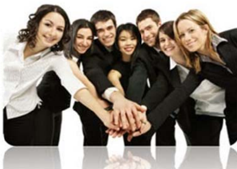
Slika 3 – Kohezija u timu

Kohezija (franc. cohésion , prema lat. cohaerere : prijanjati, biti povezan) je riječ koja se koristi u mnogim poljima, političkom, kemijskom, socijalnom itd., u našem slučaju ona je sila koja povezuje tim, članovi su odani timu, osjećaju uzajamnu privlačnost prema ostalim članovima te vole sudjelovati u timskim aktivnostima. Što je jači taj osjećaj pripadnosti i zadovoljstva u grupi to je kohezija naravno veća; jaku koheziju prepoznajemo u timovima koji su ponosni što su dio njega, solidarni su te spremni na pomoć, entuzijastični, pripremljeni na prepreke i greške, uživaju u druženju sa kolegama i izvan radnog mjesta. 8