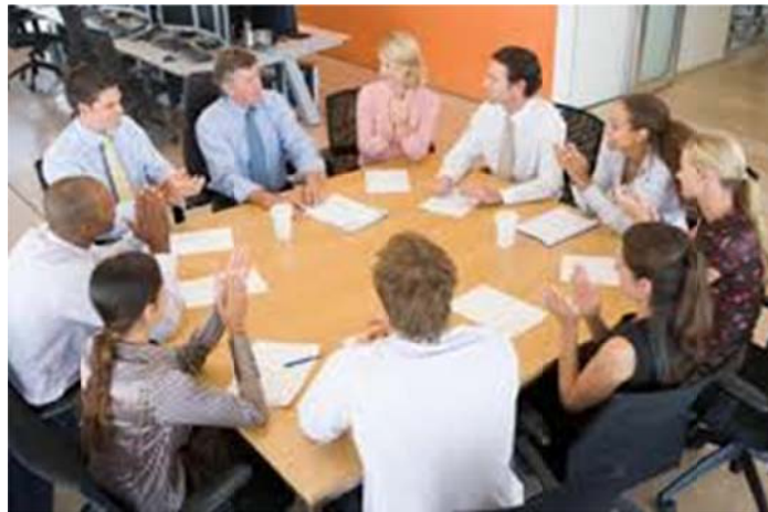
Slika 4 – Timski sastanak

Uspješan sastanak je ključan za uspjeh tima jer potiče participaciju u raspravi, no opće poznato je da ljudi često ne vole ići na sastanke jer im troše vrijeme, predugi su, neproduktivni, dominiraju uvijek iste osobe pa se oni osjećaju izostavljenima itd. U samoupravljačkom će timu uvijek biti mjesta za svakoga da bude vođa, ovisno o temi sastanka i kompetenciji zaposlenika, dakle, možemo sa sigurnošću ustanoviti da nitko neće ostati izostavljen. Produktivni razgovori su najvažnija interakcija koja se stvara među članovima tima, oni uspješni najčešće imaju otvorenu i dobru komunikaciju. 16