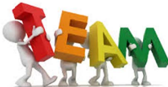
Slika 2 – Team

ali i kada se cilj bitno promijeni ili bude ukinut, promjena vlasnika kompanije ili kada tim napusti puno članova koji se ne mogu nadomjestiti niti nadoknaditi povećanim opsegom rada. 3