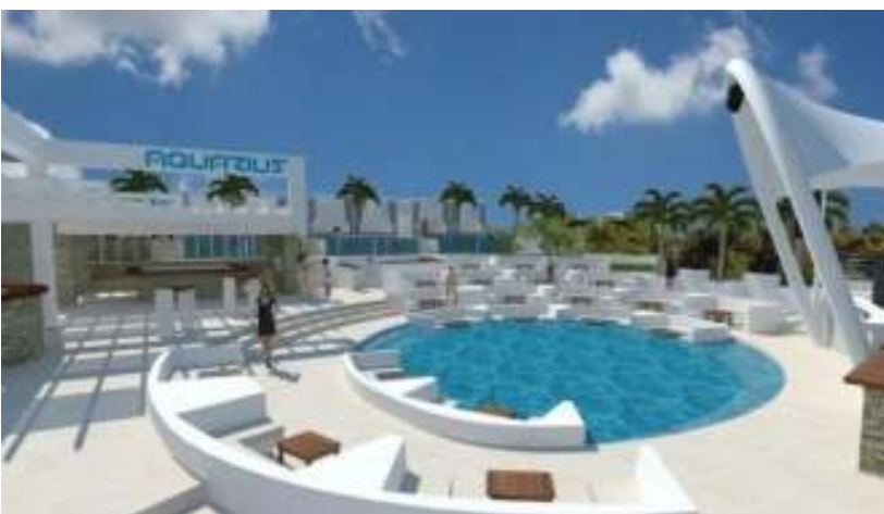
SLIKA 7 Aquarius club Zrće

Cilj bilo kojeg ugostiteljskog projekta je isti locirati na posjećeno i popularno mjesto. Aktivnim kontaktima sa ugostiteljima sa Zrća postignut je dogovor da se Aladin shisha bar locira u sklopu Aquarius club-a Zrće.