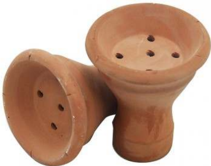
SLIKA 5 Primjer čašice za duhan