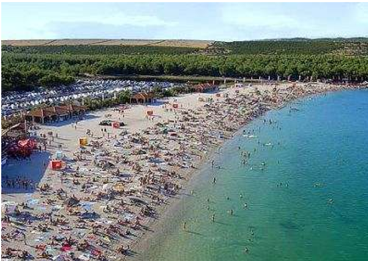
SLIKA 8 Plaža Zrće iz zraka

Zrće je kao lokacija idealna iz nekoliko razloga: iz godine u godinu bilježi se rast broja gostiju, smatra se glavnom party destinacijom na Jadranu, gosti dolaze iz zemalja gdje je pušenje nargile svakodnevna pojava itd.