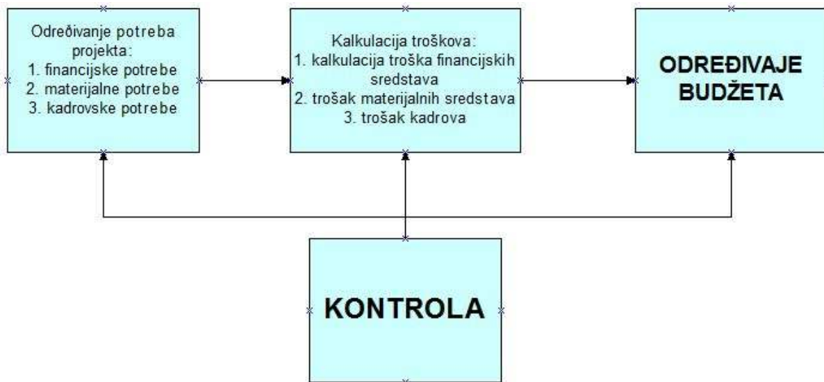
SLIKA 2 Proces donošenja budžeta