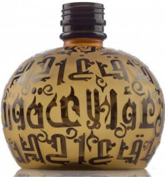
SLIKA 4 Boca nargile

Da bi se nargila kvalitetno pripremila mora se obratiti pažnja na nekoliko detalja. Prije svega, voda koja se ulijeva u posudu nargile morala bi biti što hladnija kako bi kvalitetnije hladila dim. Također se mora obratiti pažnja da količina vode u posudi bude dobro odmjerena kako se ne bi dogodilo da se kroz crijevo uvlači i voda ukoliko je posuda prenapunjena.