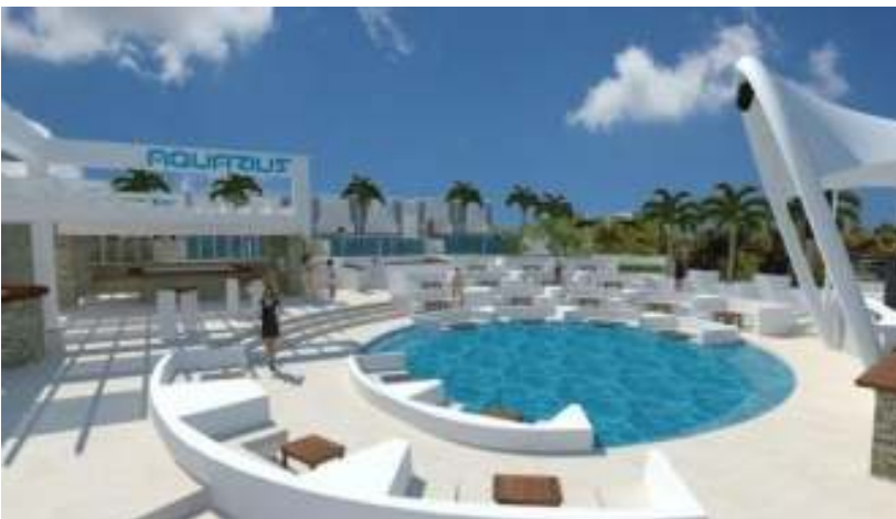
SLIKA 7 Aquarius club Zrće

Cilj bilo kojeg ugostiteljskog projekta je isti locirati na posjećeno i popularno mjesto. Aktivnim kontaktima sa ugostiteljima sa Zrća postignut je dogovor da se Aladin shisha bar locira u sklopu Aquarius club-a Zrće.