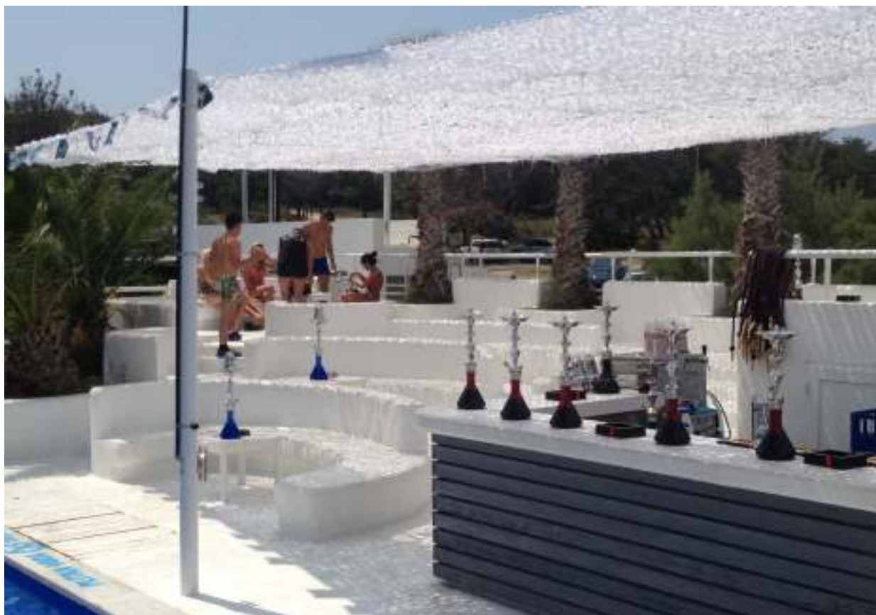
SLIKA 9 Aladin Shisha Bar

Rezultat ove suradnje je Aladin Shisha Bar Zrće.