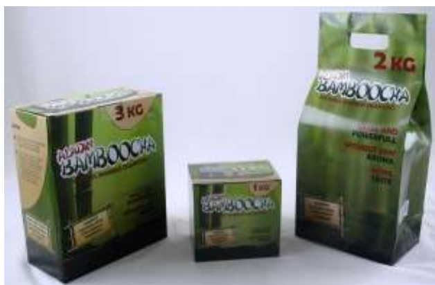
SLIKA 6 Aladin Bamboocha ugljen za nargilu

Također je vrlo bitno kakvu vrstu ugljena se koristi prilikom pripreme nargile. Idealno bi bilo koristiti takve vrste ugljena koje proizvode optimalnu temperaturu, gore dovoljno dugo i najbitnije od svega je da nemaju nikakav miris.