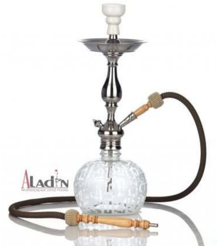
SLIKA 3 Primjer moderne egipatske nargile